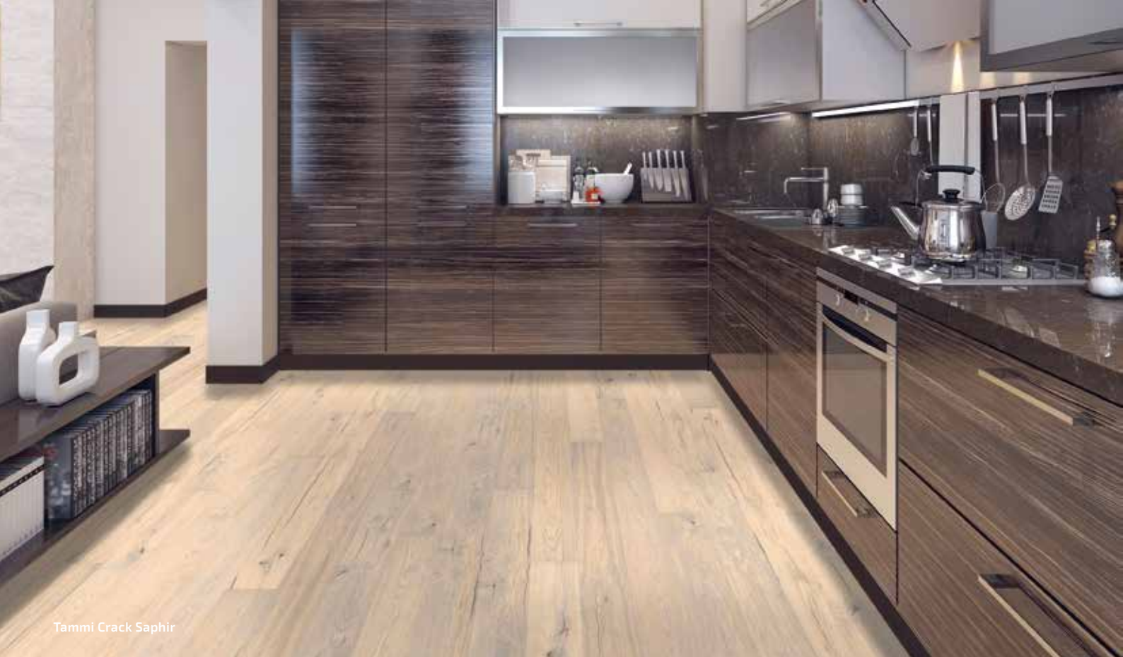
Tammi Crack Saphir